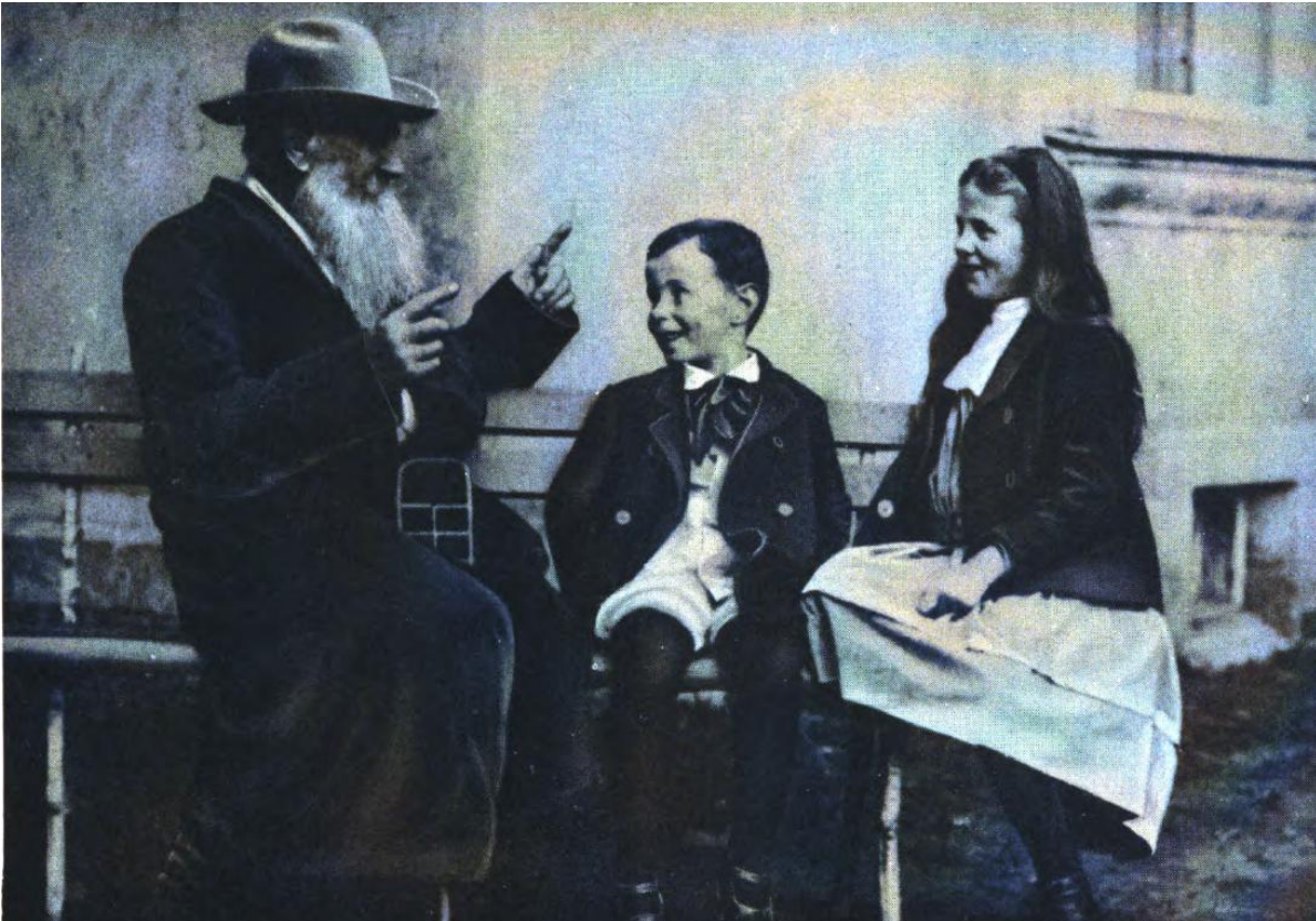
Tolstoi im Kreise seiner Enkel

In diesen Zeilen erkennt man leicht den Denker, der die uns bereits bekannten Gründe ersonnen hat, warum man sich dem Uebel nicht widersetzen soll: „Völlerei“, an der mein Freund, den ich heute vor dem tollwütigen Hund rette, „nach vielen Jahren“ stirbt; die „Seuche“, die morgen meine Kinder dahinrafft, die ich heute den Händen des „Zulu“ entreiße. Falls es „keine Verlängerung der Agonie ist“, wenn man einen Menschen für