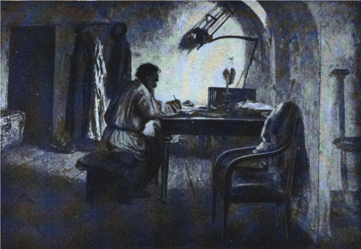
Tolstoi in seinem Arbeitszimmer

Verhältnisse, Gedanken und Gefühle, die auf einem Herrngut entstanden, auf eine gänzlich andere und gegensätzliche Wirklichkeit. Sein ständiges Predigen, daß das Heil der Menschen von ihrer inneren Wandlung abhängt und nicht von einer Aenderung der äußeren Verhältnisse, entsprang nicht nur seiner Höherbewertung des Geistigen gegenüber dem Materiellen, nicht nur seinem religiösen